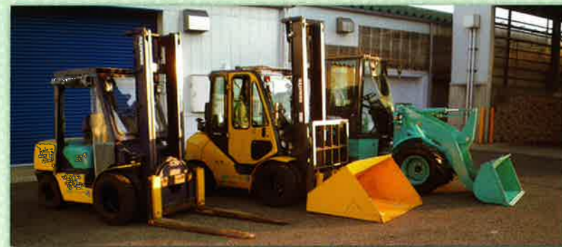
水分調整材としてのもみ殻ストックヤード