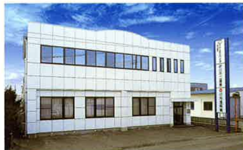
株式会社 不二産業 本社事務所