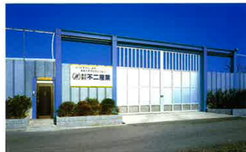
一日市ヤード/積み替え保管施設 中間処理施設