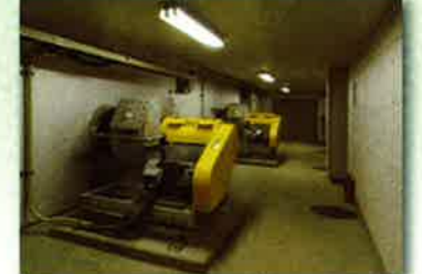
臭気吸引ターボブロフ