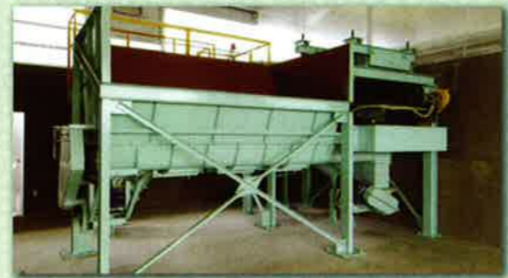
堆肥中の異物除去機