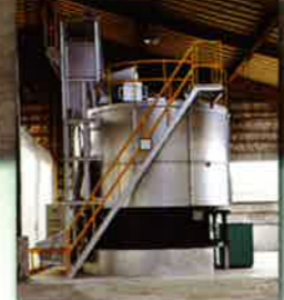
高速発酵コンポスト