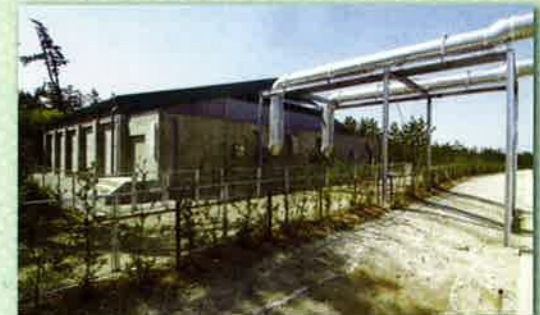
ロックウォール脱臭槽(容積900m³)全景