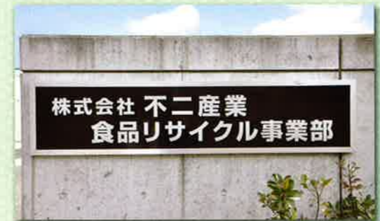
リサイクルセンター ネームプレート