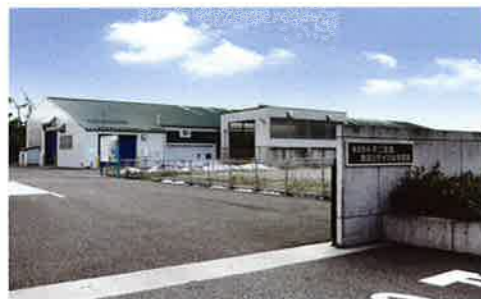
食品リサイクル事業部工場