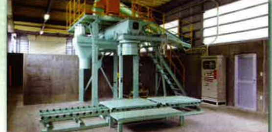
堆肥ふるい分けと袋詰め装置