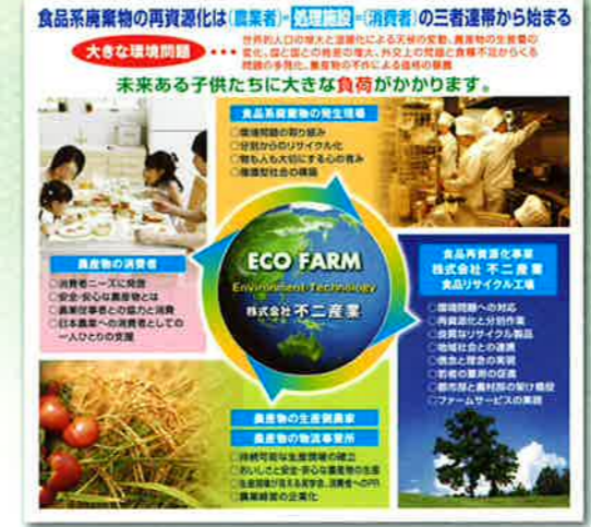
リサイクルセンター入口看板