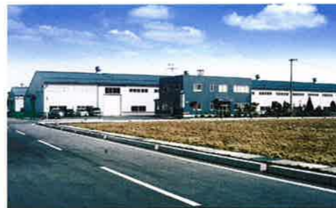
株式会社 フジ・エンバイロ 再資源化工場