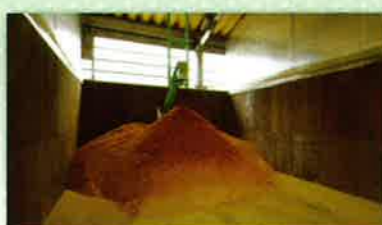
粉体になったもみ殻(水分調整材として使用)