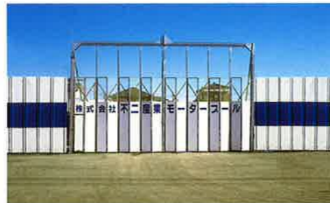
収集運搬部門 モータープール