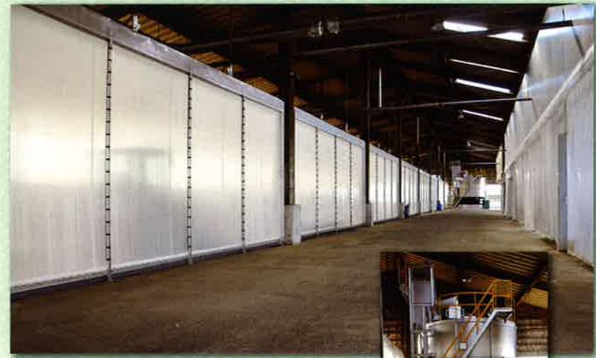
醗酵棟内のカーテン・臭気吸引ダクト (工場内は常に陰圧となります)