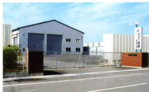
株式会社 不二産業 東港工場